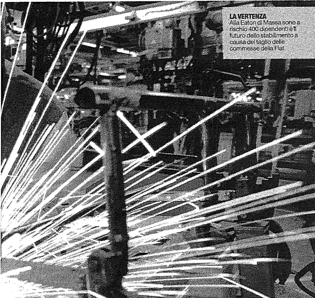
LA VERTENZA Alla Eaton di Massa sono a rischio 400 dipendenti e il futuro dello stabilimento è in causa del taglio delle commesse della Fiat